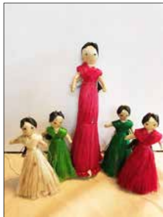
Handgjorda dockor från SUS kommer att säljas på Schysst julmarknaderna.

Vi kommer att sälja hantverk från SUS, informera om SUS verksamhet och om vår