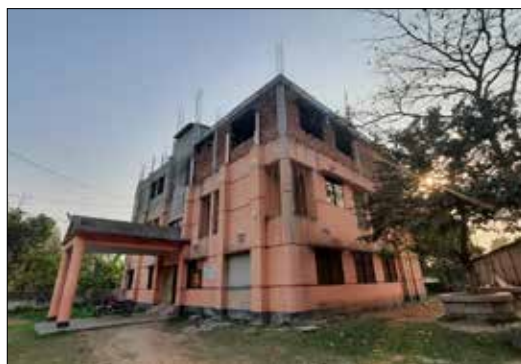
Dream House tredje våning på väg att färdigställas.