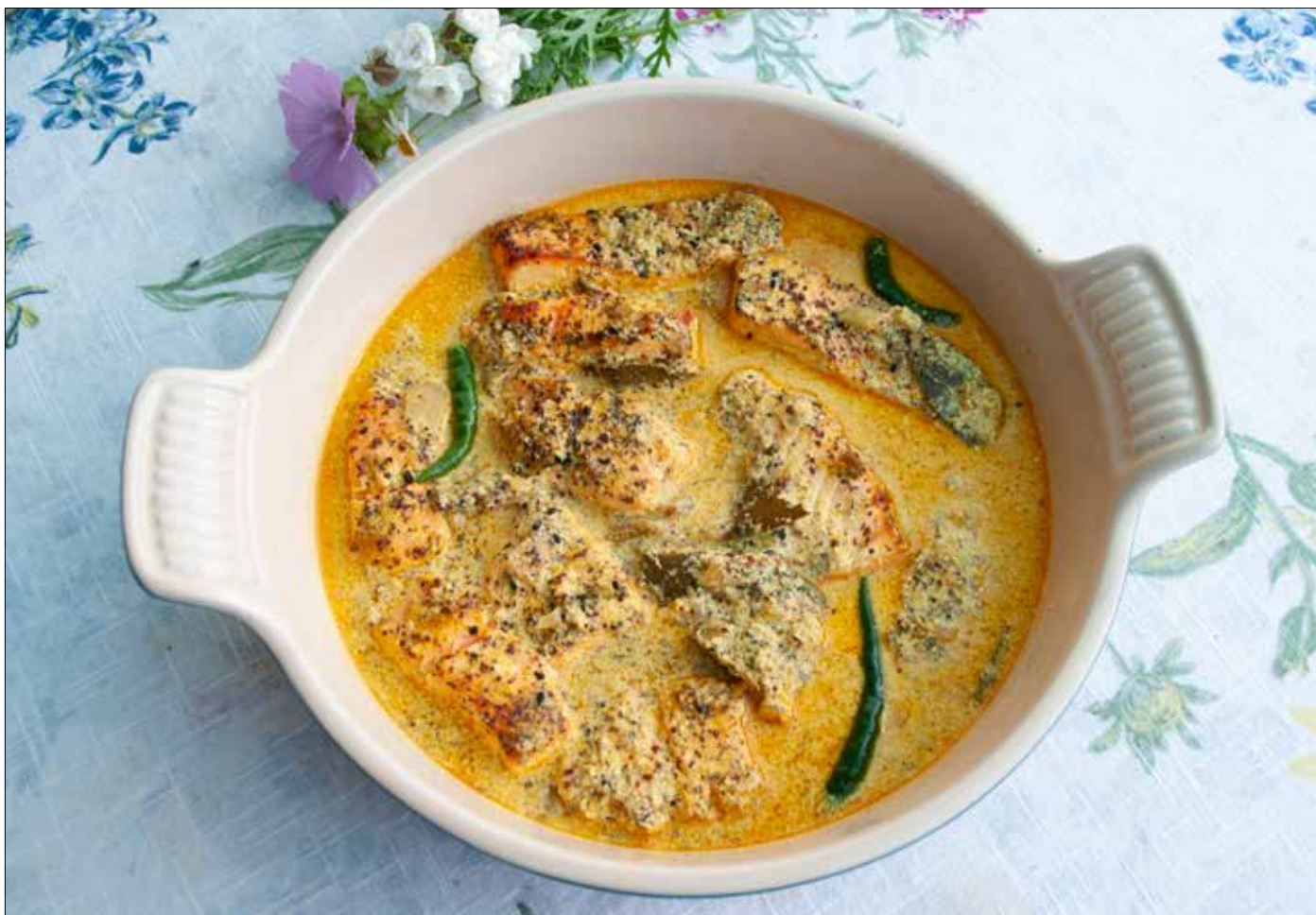
Lax ersätter den populära bangladeshiska fisken hilsha i receptet nedan.