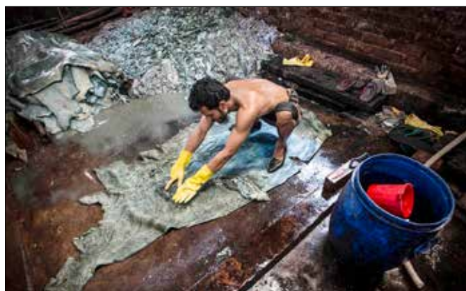
Många arbetare utvecklar kronisk hosta, som tros vara orsakad av att de andas in svavelsyra och andra giftiga ämnen.