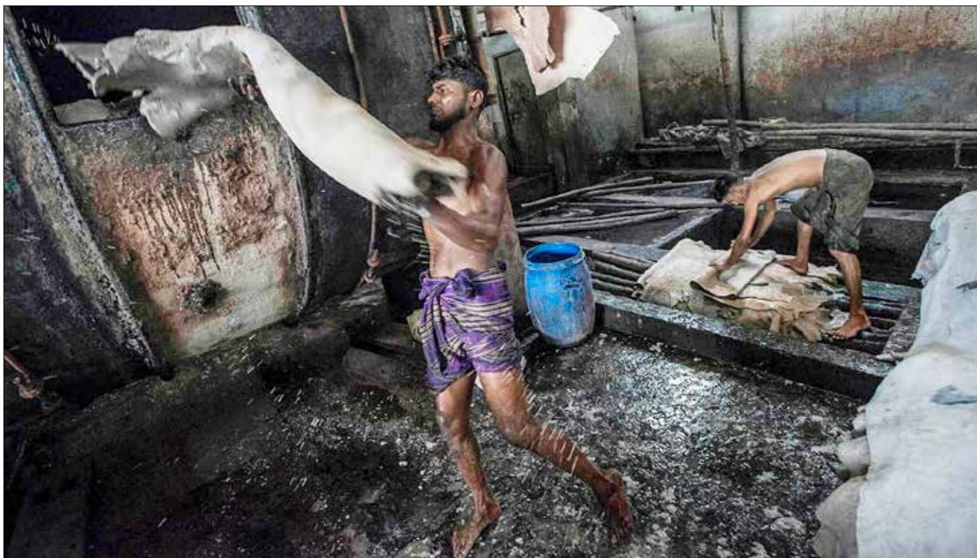
I Bangladesh garvas en stor del av de skinn som blir till väskor och andra konsumtionsvaror i västvärlden.