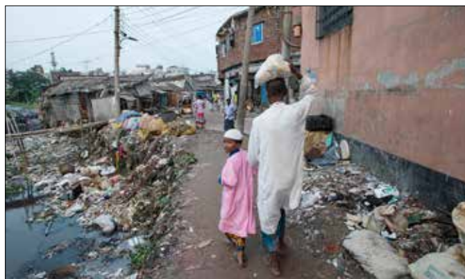
Den förorenade stadsdelen Hazaribagh i centrala Dhaka.