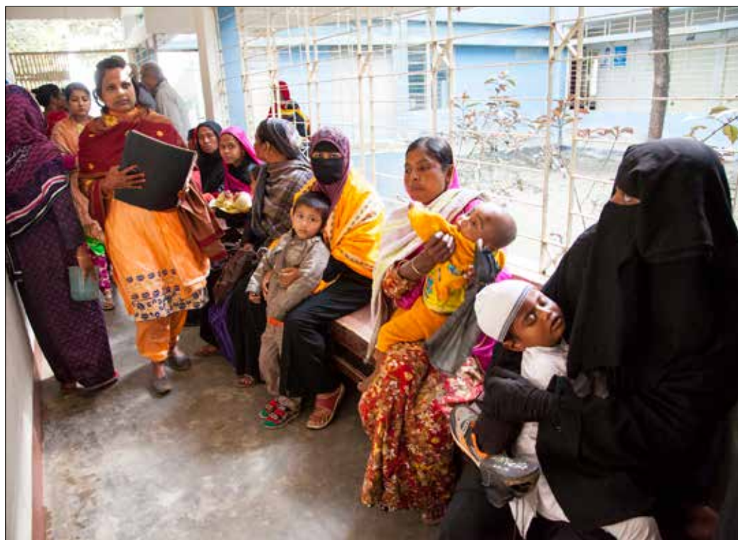
En gång i veckan behandlas patienter med klumpfot på SUS sjukhus.

Muren har lagats, totalt 540 fruktträd har planterats, 3 000 fiskyngel har släppts i dammen, en maskkompst har byggts liksom en modellträdgård på 6x6 meter. Man har också köpt två kor. För att vägen utanför muren ska bli