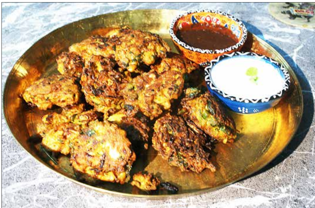
Vitkålspakora med tamarind- och yoghurtsås att doppa dem i.