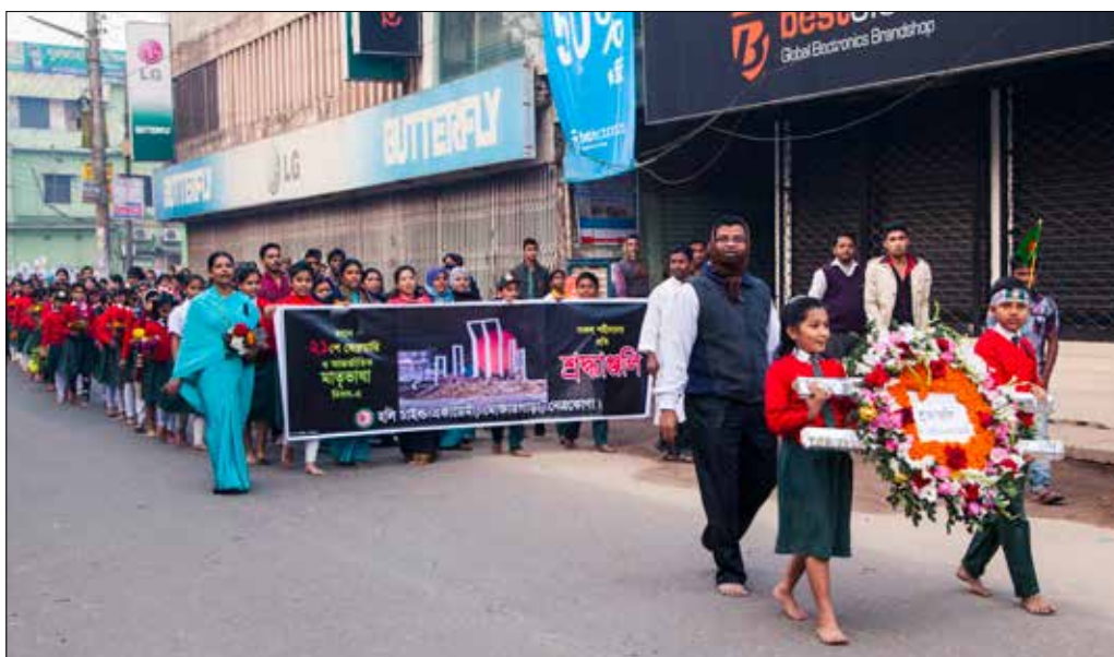
Modersmålsdag i Netrakona. Över hela landet firas modersmålsdagen, som här i Netrakona där eleverna marscherar för att lägga blommor på frihetsmonumentet.