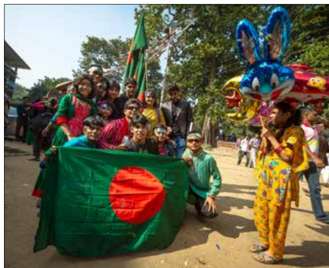
Bilder från 16 december 2012. Över hela landet firas självständighetsdagen och gatorna fylls av finklädde flaggviftande människor.