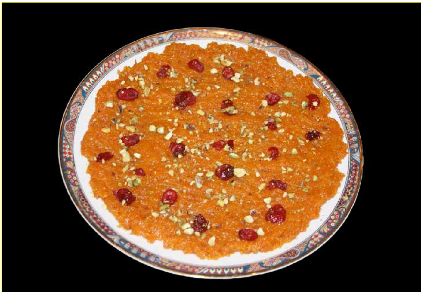
Färgglad dessert. Morotshalua tror vi platsar väl bland andra godsaker till jul.