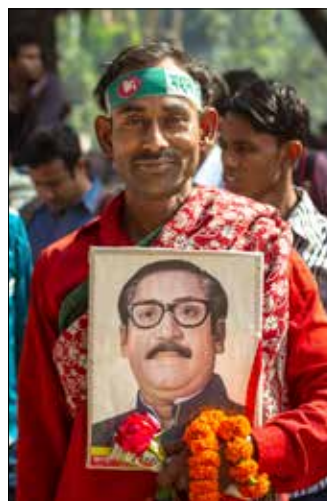
Landsfadern på bild. Sheikh Mujibur Rahman.

ledaren för Pakistan People's Party, tillät inte Sheikh Mujibur Rahman att göra detta.