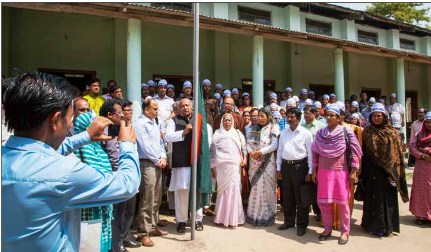
Respekterad organisation. Begum Rokeya och SUS är i dag högt respekterade i Netrakona.