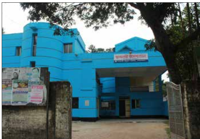
Renoverat. SUS sjukhus har fräschats upp och nya patientsängar har köpts in.

Statistiken visar att av sjukhusets patienter är drygt 80 procent kvinnor, som till största delen lämnar prover till laborato-