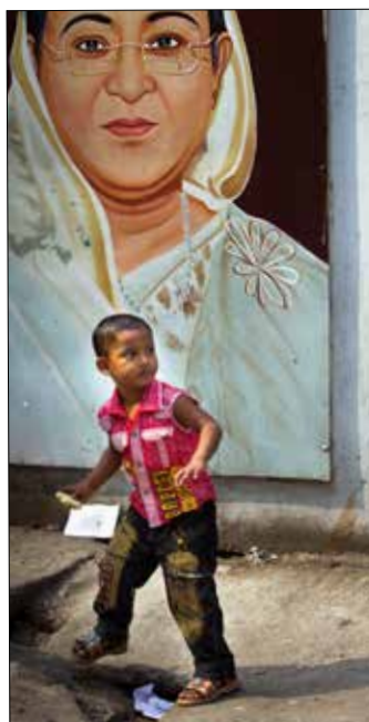
Dhaka. Väggmålning med Sheikh Hasina, vars parti Awami League vann valet i december.

Regeringspartiet Awami League och dess allianspartier vann valet för tredje gången