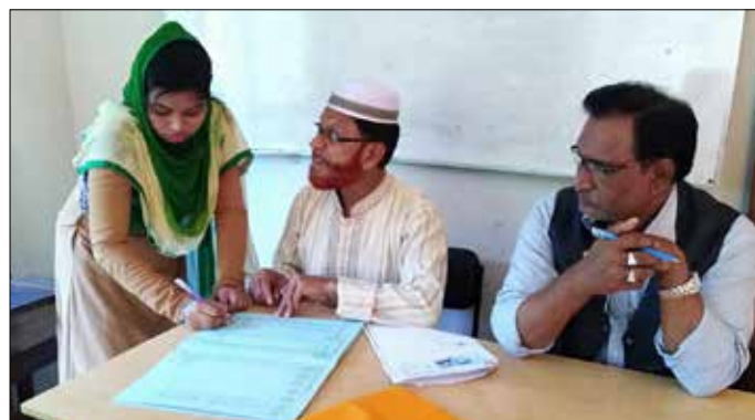
Baby misshandlades av mannens familj.

Polisen beskrev fallet som självmord och la ner det. SUS och andra organisationer bildade en mänsklig kedja och krävde rättvisa. Efter massiva protester gav polisen med sig och